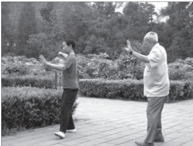
Ilustr. 1. W Chinach powszechne jest wykonywanie ćwiczeń zapewniających energetyzację organizmu

Z kolei specjalne zestawy ćwiczeń Qigong zapewniają odpowiednią energetyzację organizmu. W ten sposób, poprzez działania dotyczące otoczenia człowieka (feng shui), jak i bezpośrednio jego ciała i umysłu (ćwiczenia oparte na Qigongu), możemy stworzyć optymalne warunki do życia. Opisane są także najpopularniejsze chińskie symbole i talizmany. Chciałbym podkreślić, iż prezentowane w książce zalecenia są proste i łatwe do zastosowania przez każdego z czytelników.