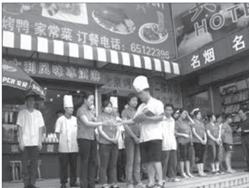
Ilustr. 4. Dyscyplina to bardzo ceniona cecha w Państwie Środka. Na zdjęciu poranna odprawa pracowników przed pekińskim barem

są jednak liczne wyjątki. Na przestrzeni dziejów Chińczycy potrafili buntować się przeciw despotycznym władcom.