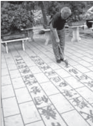
Ilustr. 3. Ćwiczenia kaligrafii na chodniku pekińskiego parku

Chińczycy nadal bardzo wysoko cenią sztukę kaligrafii, dotyczy to zarówno ludzi prostych, jak i wykształconych. Odbywają się liczne konkursy w tej dziedzinie, zaś w parkach można spotkać osoby, które ogromnymi pędzlami na płytach chodnikowych ćwiczą pisanie znaków. Mówiąc obrazowo – chińska kaligrafia to malowanie słowami. Stanowi ona rodzaj poezji wizualnej, gdzie kształty i niuanse poszczególnych ideogramów nabierają piękna powiązanego z ich znaczeniem.