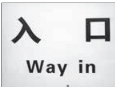
Ilustr. 2. Napis: Wejście składający się z dwóch stosunkowo łatwych do rozszyfrowania ideogramów

Warto znać kilka przydatnych reguł językowych dotyczących chińskiego. Otóż Chińczycy podają najpierw nazwisko, a potem imię. Zdarza się, że przedstawiają się albo samym imieniem, albo nazwiskiem i imieniem. Wiele nazwisk powtarza się, gdyż istnieje tylko 438 ich różnych wersji. Najbardziej popularne to Wang , Zhang i Li . Gdyby wszyscy Wangowie chcieli założyć