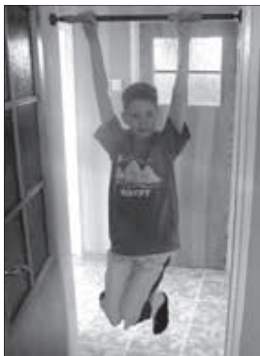
Zwis na drążku

Nie zawsze mamy możliwość korzystania z usług kręgarza. Jeśli mamy bóle w plecach związane z różnego rodzaju schorzeniami kręgosłupa, proponowałbym typowy drążek gimnastyczny. Czasami na ból kręgosłupa pomaga zwykły zwis na drążku, powstaje wtedy tzw. trakcja kręgosłupa: ciało nasze rozciąga się pod wpływem własnego ciężaru, jednocześnie rozciągając nasz kręgosłup.