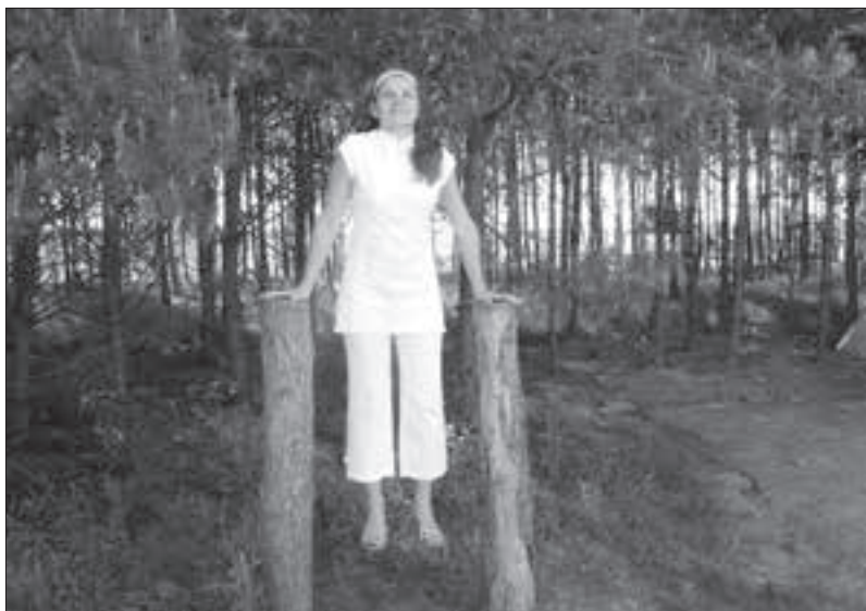
Wspieranie się na kołkach – zwis

Wielu sportowców stosuje tę metodę. Chwytają się ręko- ma drążka lub drabinek, nogi podciągają lekko do góry i lek- ko skręcają się na boki. Powoduje to, że delikatnie wysunięte kręgi wchodzi na swoje miejsce, a sól międzykręgowa wsku- tek zwisu i skrętów naszego ciała kruszy się, nie powodując uszczywnień kręgosłupa. Charakteryzuje się to lekkim chrup- nięciem. Myślę, że większość osób doświadczyła tego uczucia chrupnięcia w kręgosłupie, na skutek zawieszania się na ga- łęzi, drążku lub na skutek ćwiczeń gimnastycznych. Drążek taki możemy kupić w sklepie sportowym. Zawieszamy go np. między futrynami. Po zastosowaniu ćwiczeń Koluch Chi, chwy- tamy się drążka i podkulamy kolana. Staramy się, aby przy zwisie nasze ręce były wyprostowane. Nie wykonujemy tu żad- nych gwałtownych ruchów, szarpnięć, skręceń. Wisimy od 5