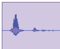
Wykresy zwrotów „w połowie pełna” (z lewej) i „w połowie pusta” (z prawej).