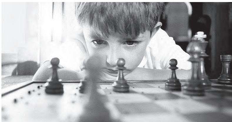
Dziecko zaabsorbowane grą w szachy

Proces neuroplastyczności mózgu jest oczywisty, kiedy nabywamy nowe mechaniczne lub intelektualne umiejętności. Weźmy dla przykładu klasę języka rosyjskiego dla dorosłych na uniwersytecie; do końca pierwszej lekcji, zdołałeś nauczyć się kilku słów. Po roku praktyki, zbudowałeś te połączenia nerwowe na tyle, by wypowiadać proste zdania po rosyjsku bez świadomego wysiłku.