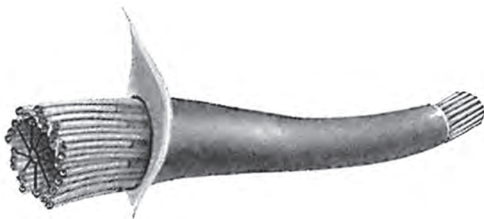
Mikrotubule są sztywną strukturą szkieletową nadającą komórkom ich kształt

Nawet struktura samych neuronów wciąż się zmienia. Mikrotubule stanowią rusztowanie dające komórkom ich sztywność, podobnie jak dźwigary utrzymują budynek. Mikrotubule w komórkach mózgowych żyją przez zaledwie 10 minut od powstania do destrukcji (Kimi Coulombe, 2010). Tak szybko zmieniają się nasze mózgi.