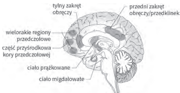
Regiony mózgu, które wzrastają w wyniku medytacji

ćwiczyć medytację, w twoim mózgu przebiega proces budowania i burzenia. Do obwodów neuronowych, których używasz najbardziej dodajesz nową moc, podczas gdy stare więdną w procesie zwanym zanikaniem.