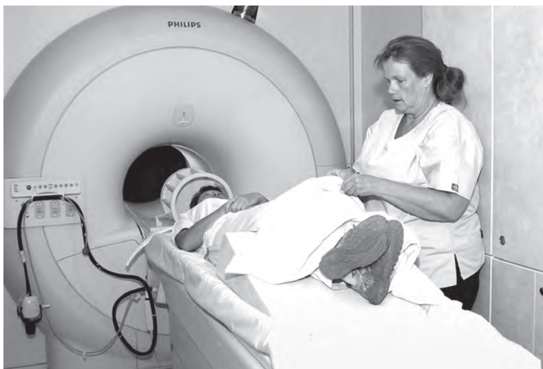
Pacjent podczas badania MRI

Być może stwierdzasz, że chciałbyś lepiej zarządzać swoimi pieniędzmi. Sprawdzasz wyciągi swojego planu emerytalnego i zauważasz, że pod czułą opieką twojej organizacji finansowej, twoje fundusze będą rosły o 2 procent rok do roku. Ktoś się tu bogaci, ale to z pewnością nie jesteś ty. Myślisz, że poradziłbyś sobie lepiej sam, zapisujesz się więc na kurs online na temat inwestycji na giełdzie. Z początku, sam język zbija cię z tropu. Co to jest covered call? Czym różni się zwrot z inwestycji od zwrotu wskaźnika rentowności kapitału własnego?