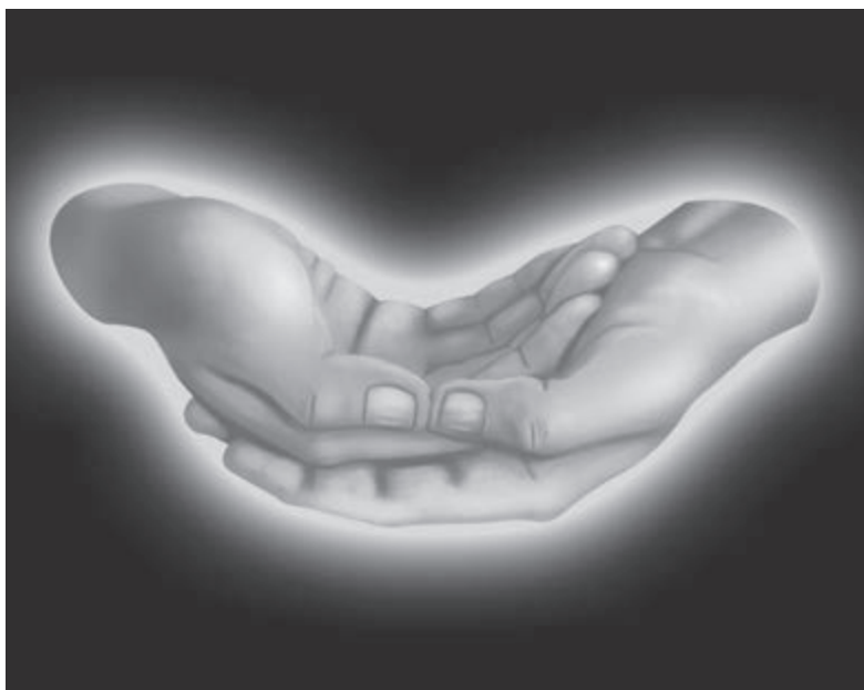
Ilustracja 10.1. Mudra dla medytacji MerKaBa.